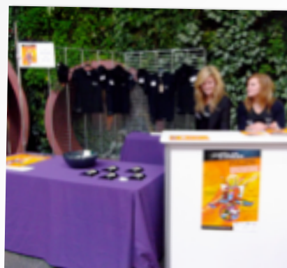
LE PÔLE « FILM »