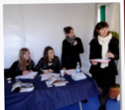
LE PÔLE « ANIMATION »