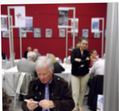
LE PÔLE « SALON DU LIVRE »