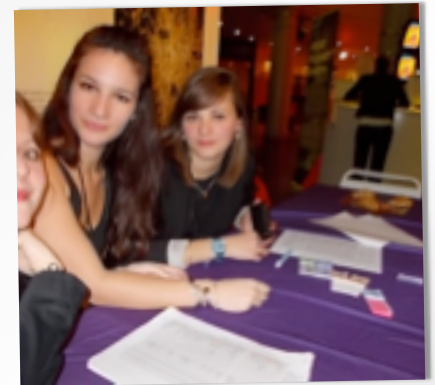
LE PÔLE « COORDINATION »